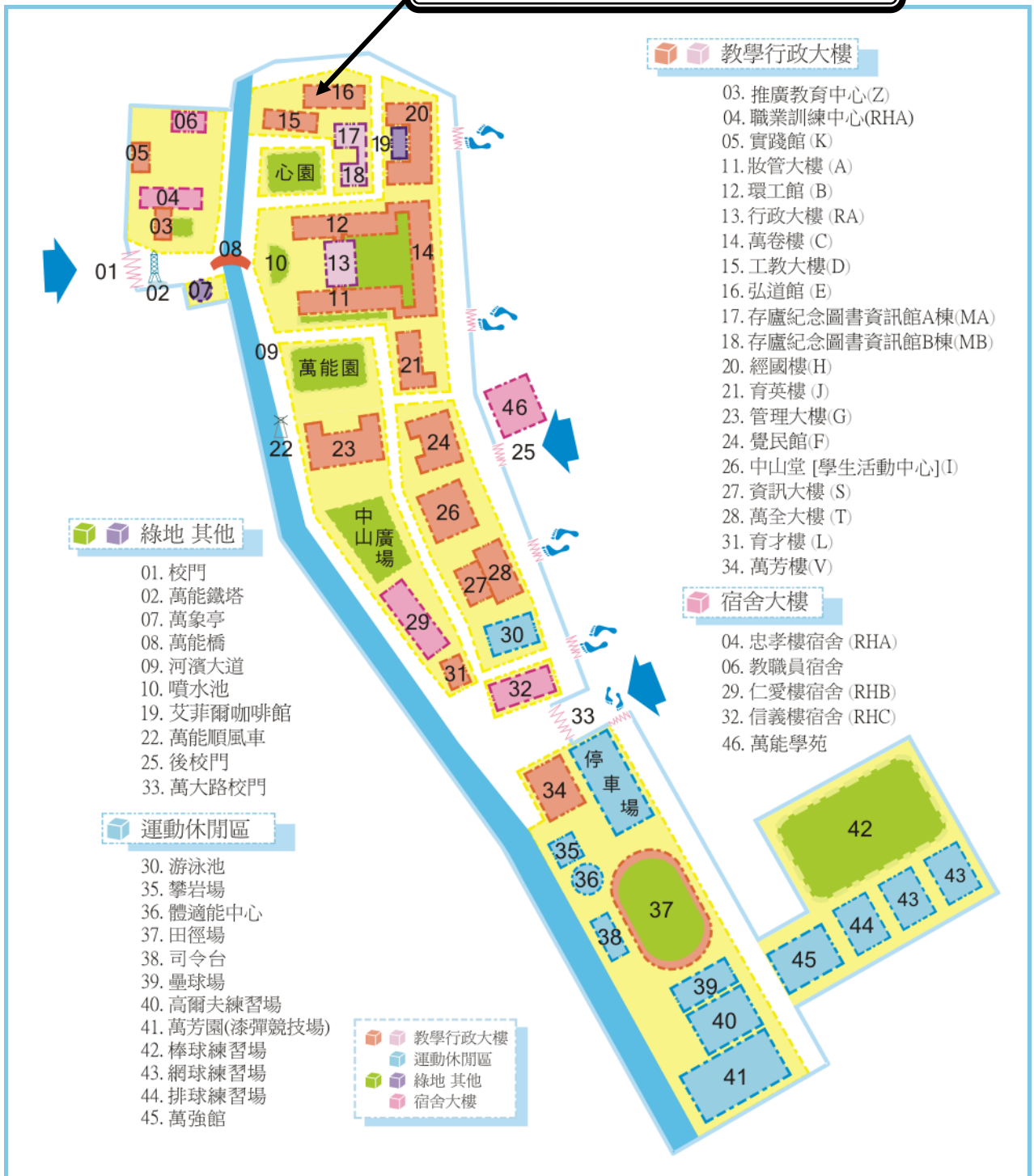
萬能科技大學校園地圖