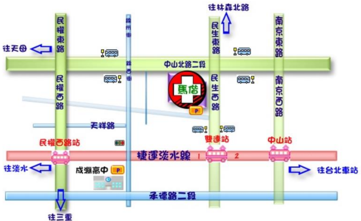
台北馬偕醫院院區地理位置圖