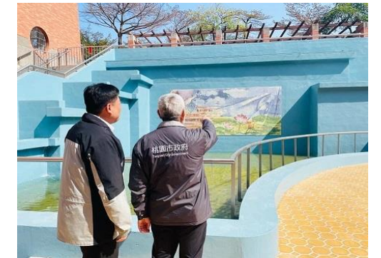
地展廣場及生態池整修