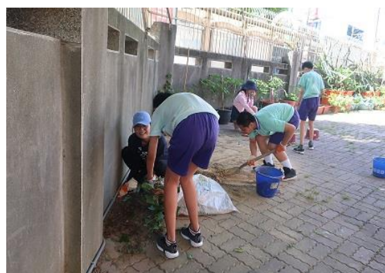
食農教育-特教農園