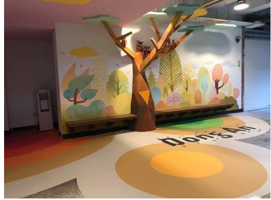
視聽教室旁廣場美化