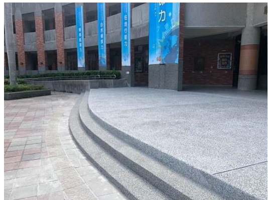
川堂平台階梯抵石子工程