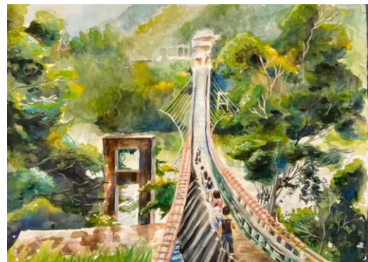
桃園市美術比賽得獎作品