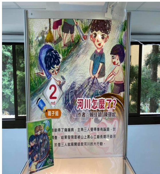
環境教育繪本創作比賽獲獎作品