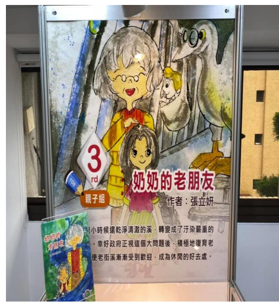
環境教育繪本創作比賽獲獎作品