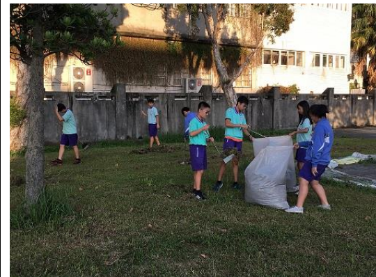
志願服務學習-校園公共環境打掃