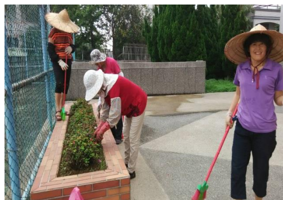
社區關係-志工媽媽整理校園草木