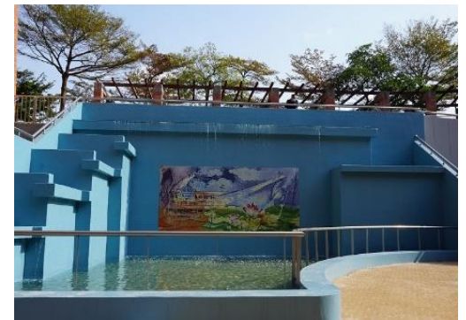
地展廣場及生態池整修