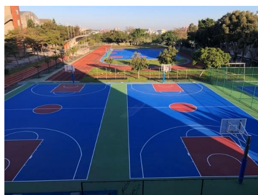
運動場排水、鋪面整修工程