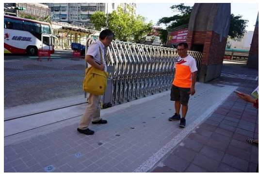
校門口排水系統改善工程