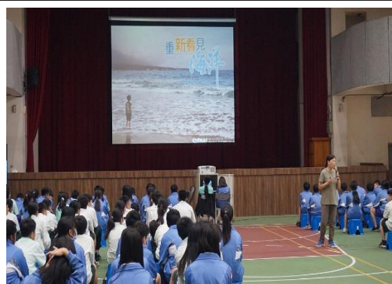
109 年度環境教育研習-重新看見海洋