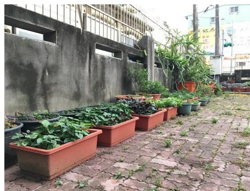
食農教育-特教農園