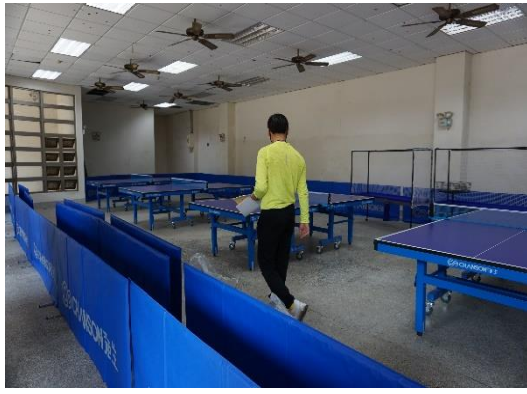
活化校園閒置空間—增設桌球教室