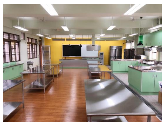
活化校園閒置空間-家政教室