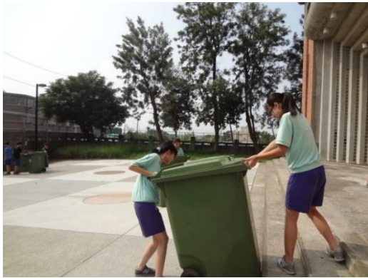
登革熱防治-積水容器清除