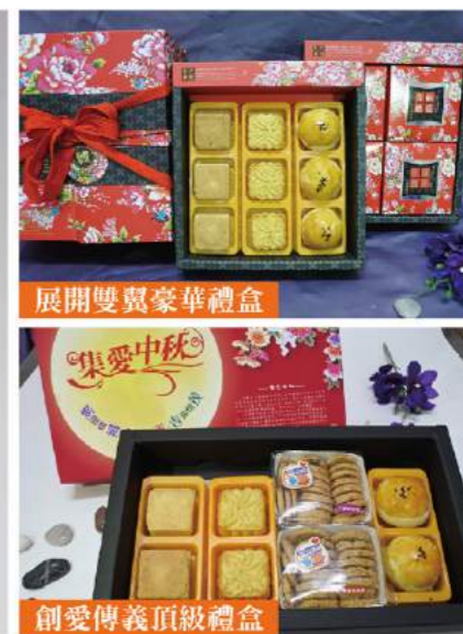
展開雙翼豪華禮盒