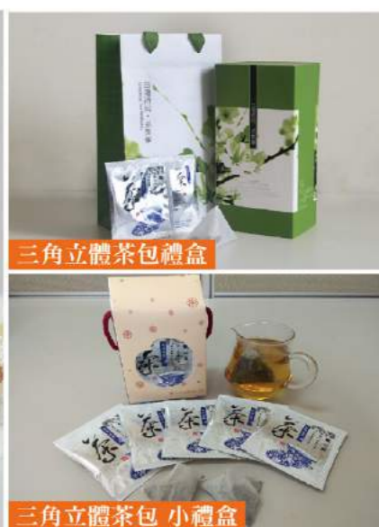
三角立體茶包禮盒