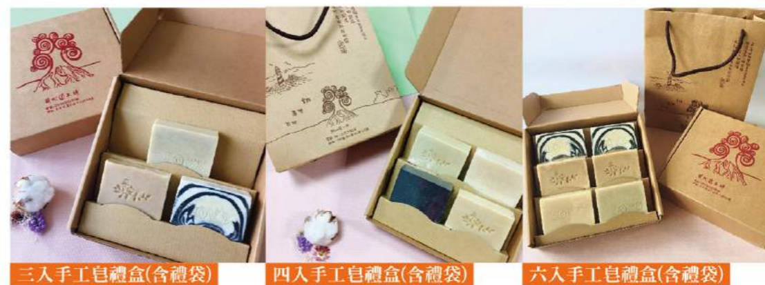
三入手工皂禮盒(含禮袋)

同心圓是一群關心精神障礙者復元議題的人們所成立，我們提供一個場地、一些設備、一些技能；藉由任務的參與，成員彼此學習相互溝通協調，學習相互依賴與扶持，以成就彼此的圓滿。我們衷心期盼與邀請每個人都能停下腳步參與我們，進而瞭解到精神障礙者的生命尊嚴與意義，我們視每一個人為獨立、自主、自由，有能力學習的個體，每一個人可以在同心圓裡自在成長、沈澱與挑戰未來。