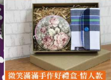
微笑滿滿手作好禮盒-情人款