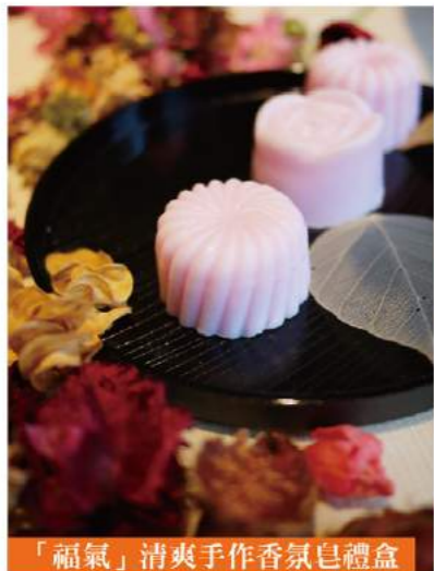
「福氣」清爽手作香氛皂禮盒

高雄市脊髓損傷者成功之家，係為中樞神經受傷之脊髓損傷者所成立之中途訓練機構，主要提供生活自理、職業重建等免費訓練課程，協助學員激勵潛能。手作香氛皂為脊髓損傷者成功之家研發之社會福利產品，亦係針對安置學員所規劃之職能訓練課程，每顆皂實皆出自傷友們自信之作，期待您來悉心體驗。「福氣」清爽手作香氛皂，內含植物性椰子油、甘油精製而成，泡沫細緻、洗淨力強，適合肌膚清潔。