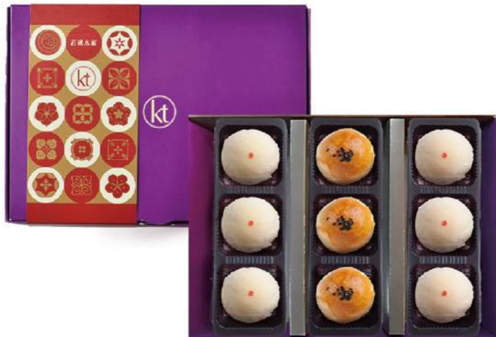
君城本家中秋禮盒