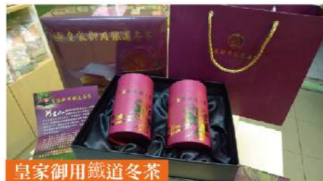
皇家御用鐵道冬茶