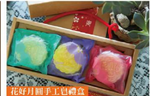
花好月圓手工皂禮盒