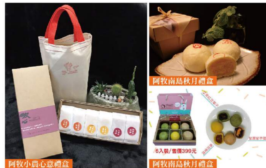
阿牧小農心意禮盒

牧心智能發展中心，於民國86年由身心障礙者家長及社會熱心人士共同成立，以「身心障礙者終身教育與照顧，推展身心障礙者福利事業」為宗旨。民國97年設立牧心底護烘焙工場，生產及包裝全程由18名庇護員工及其他心智障礙者共同完成，今年度牧心將在地農特產結合超人氣商品，設計多款中秋禮盒，邀請您一起來品嚐，來自台東的【阿牧南島月餅】，感受憨兒的認真與用心~~。