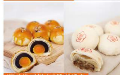
湖畔綠豆椪/蛋黃酥禮盒