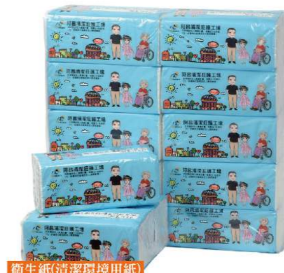
衛生紙(清潔環境用紙)