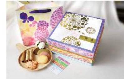
★幸福四季★克里斯多聯名禮盒