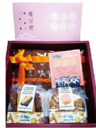
中秋手作健康禮盒

育成社會福利基金會是民國83年由北市智障者家長協會的家長及社會大眾共同籌募基金而成立，提供遲緩兒童早療及成人智障者照護服務、庇護性就業服務、家庭服務、復康巴士等等，平均每年服務超過10,000名身心障礙者及其家庭。為了身心障礙者的就業需求及培養他們的就業技能，我們創建了天然有機的餐飲品牌及健康手作、中西式烘焙產品。我們生產100%天然、不含化學添加物的產品，將健康完整的自然資源留給無數的下一代。