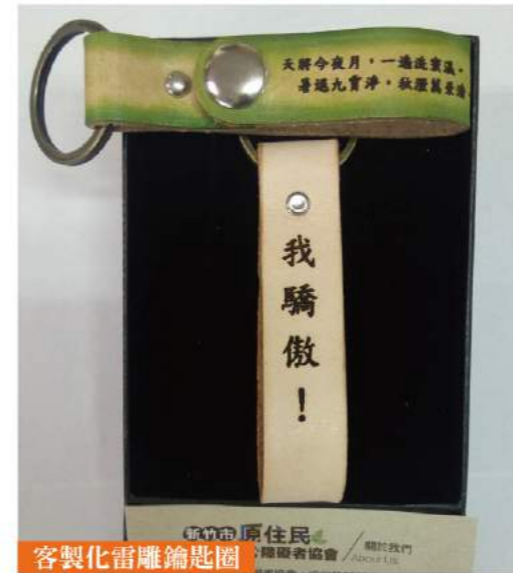
客製化雷雕鑰匙圈