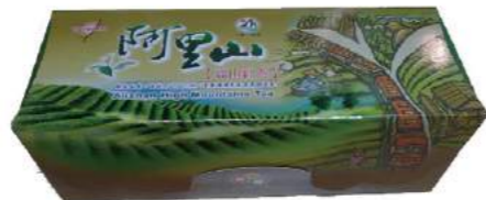
阿里山高山紅茶禮盒組(茶葉+茶包)