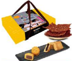
福氣六入+脆肉紙禮盒