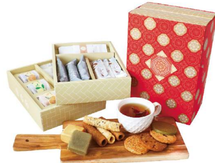
心路×捲毛力卡聯名 幸福花磚禮盒