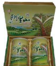
阿里山高山烏龍茶禮盒

嘉義縣身心障礙者聯合會協助身心障礙者或中高齡失業者等弱勢族群就業並結合阿里山茶區、城鄉農特產品等資源，推展茶品、農產品，開闢具未來發展性願景之庇護產品行銷推廣市場，發展在地產業，創造在地新就業機會。