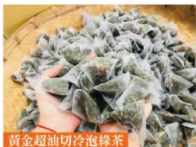
黃金超油切冷泡綠茶

來自雲林斗南的「希望工場」，每日服務約六十位的心智障礙者學員們每天開心的到工場接受日間照顧與訓練，協會理念：「幫助身心障礙者獨立生活、擁有工作、創造生命價值」邀約各位朋友們，做好事過中秋！一粒粒鑽石級手工爆米花，新鮮食材、減糖去油製作，口感酥脆，令人忍不住一口接一口。黃金超油切冷泡綠茶，使用三角立體茶包，讓茶葉可盡情舒展，內含蒸菁綠茶、玫瑰、水溶性膳食纖維，黃金油切配方，能輕鬆解膩、無負擔。