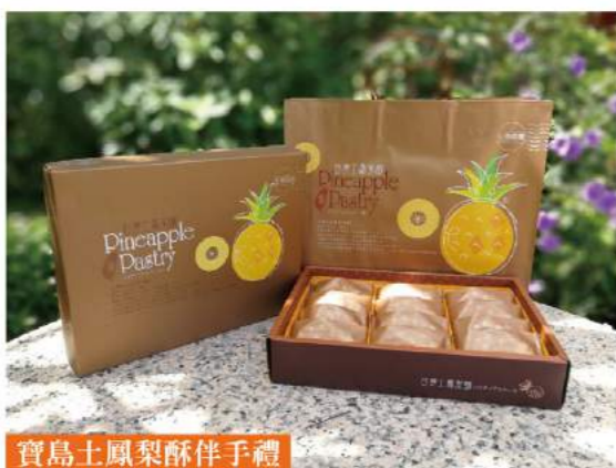
寶島土鳳梨酥伴手禮