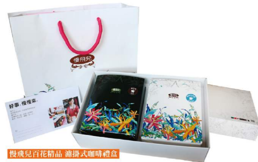
慢飛兒百花精品 濾掛式咖啡禮盒

民國97年12月通過新竹市政府立案設立《慢飛兒庇護工場》，提供具工作意願與工作能力之身心障礙朋友就業機會，予以邁向自力更生的途徑。《慢飛兒庇護工場》以清潔、環保、健康為營業方針，以慢活、樂活、幸福生活為理念，期望打造自給自足的無障礙生命驛站，陪伴成年身心障礙朋友成長、蛻變，進而成為社會的生力軍。慢飛兒庇護工場主要經營二手賣場及慢飛兒咖啡坊，提供咖啡點心、二手商品交流、愛心伴手禮，並生產、推廣自有品牌《慢飛兒咖啡》，給予慢飛兒展翅飛翔的無限可能。誠邀您來到這個幸福的所在，與慢飛兒一起發現幸福、分享幸福的生活故事。