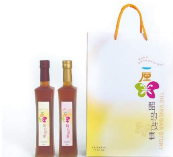
醋的故事-雙瓶組禮盒