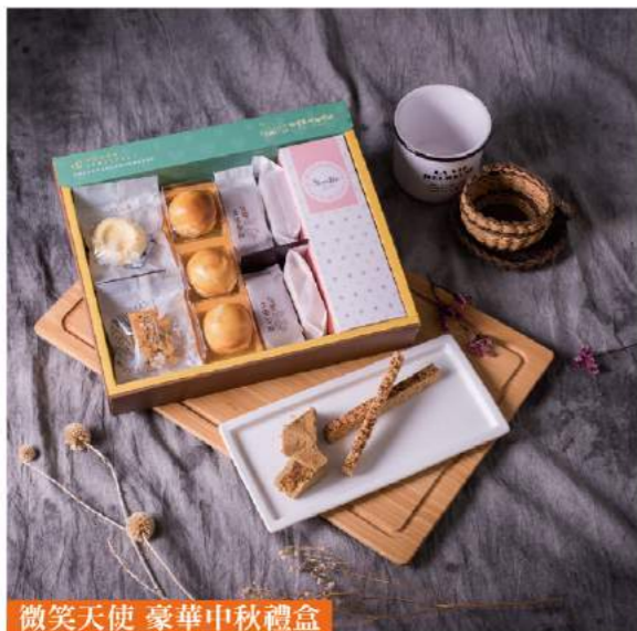
微笑天使 豪華中秋禮盒