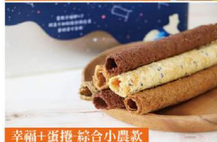
幸福+蛋捲 綜合小農款