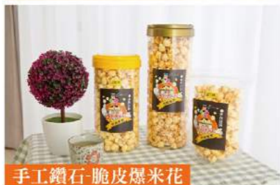
手工鑽石-脆皮爆米花