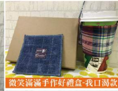
微笑滿滿手作好禮盒-我口渴款