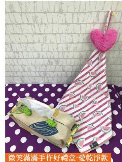
微笑滿滿手作好禮盒-愛乾淨款

陽光基金會致力於提升顏損及燒傷者之生活品質與自我價值，促進健康、安全及平權的社會環境。為顏面損傷及燒傷者在生理、心理與職能重建的需求上逐步拓展到全方位的專業服務，奠定了厚實的服務根基。108年初陽光南區中心成立了「微笑發條工作隊」，啟動燒傷及顏面損傷者重返職場之就業服務計畫，期盼從每個小小商品出發，找回重返職場的力量與勇氣。