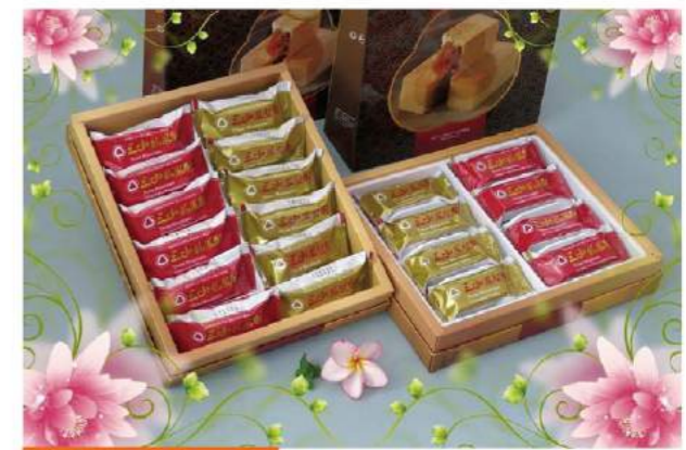
三山龍鳳雙喜禮盒