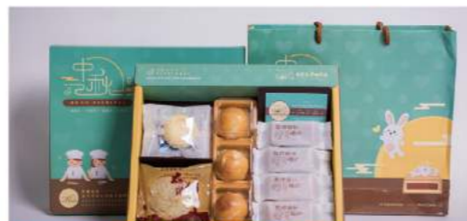
微笑天使 五福臨門中秋禮盒