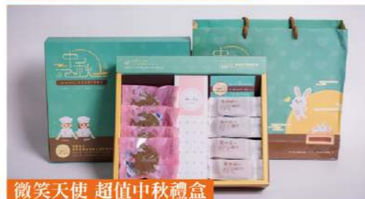
微笑天使 超值中秋禮盒