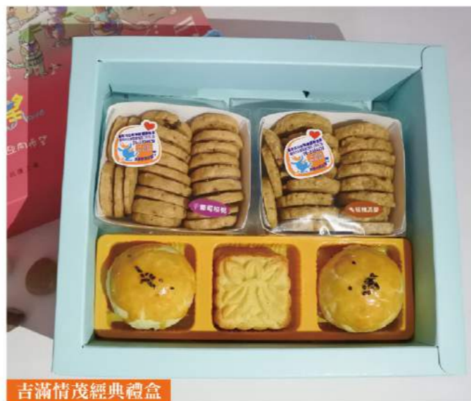
吉滿情茂經典禮盒