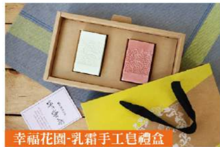
幸福花園-乳霜手工皂禮盒

「一家工場」是由高雄市政府勞工局委託心路基金會辦理的「身心障礙者庇護工場」。是一個專門為「想工作卻能力不足」的心智障礙者創造工作機會的舞台。2005年1月，心路社會福利基金會本於「成就身心障礙者最大的可能」，繼開辦洗衣工場、加油站、心路餐坊之後，在高雄鳳山開辦「一家工場」庇護工場。心智障礙者，是爸媽永遠的遺憾與心疼，是揹負一輩子牽掛的天使，「就業」是天使們想望而不能及的夢想，是爸媽更沉重的牽掛。「一家工場」從未放棄這一群天使，這個舞台讓他們享有快樂的工作機會，對人生也能懷抱希望。從習慣性的退縮，從天真不懂事，到學會做刷蛋捲餘料、蛋捲包裝、手工皂打蝴蝶結、添加精油等，每個全心全意的動作，都證明他們能贏得你我的掌聲。