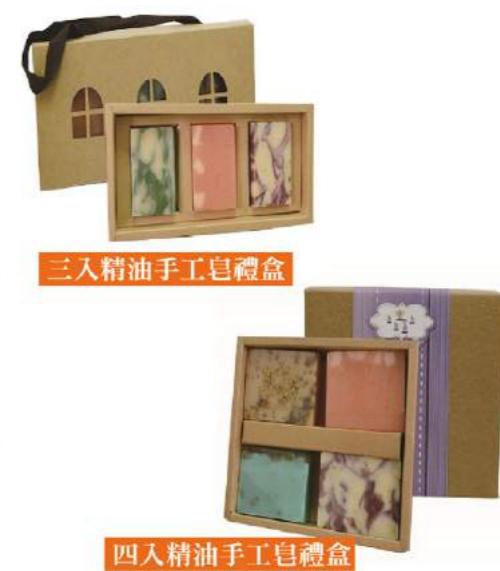
三入精油手工皂禮盒