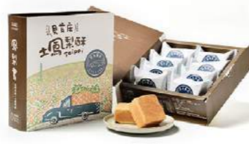
貝肯庄土鳳梨酥禮盒