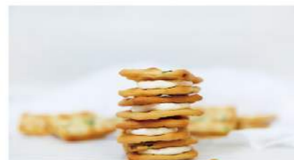
湖畔大/小牛軋禮盒

湖畔咖啡屋位於高雄長庚醫院復健大樓1樓・11樓，在醫院等待門診的時刻，讓我們用一顆誠摯的心，期待給您最佳的服務品質與全方位的滿意；讓您再等待中多了悠閒，服務超過您想像！