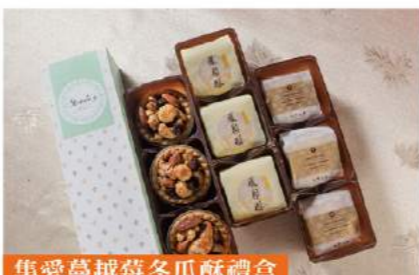
集愛蔓越莓冬瓜酥禮盒