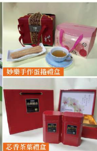
妙樂手作蛋捲禮盒