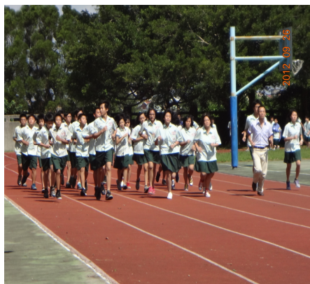
【健康體位】課間慢跑