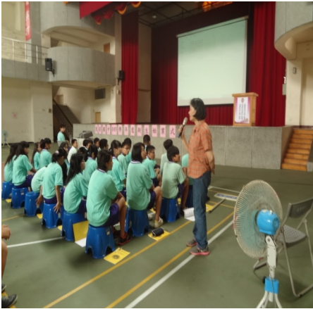
【口腔衛生】新生口腔教育宣導