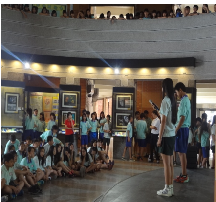
【視力保健】東安星光舞台