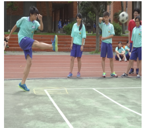
【性教育】班際足壘球比賽