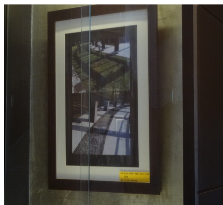
【視力保健】攝影比賽