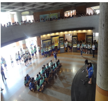
【視力保健】東安星光舞台