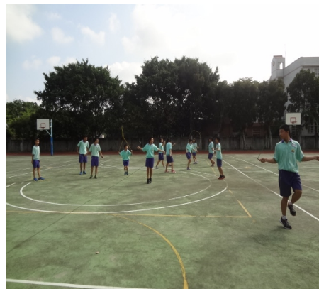
【健康體位】課間跳繩