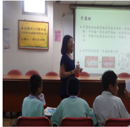
【口腔衛生】口腔衛生講座