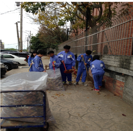
【學校衛生】社區打掃