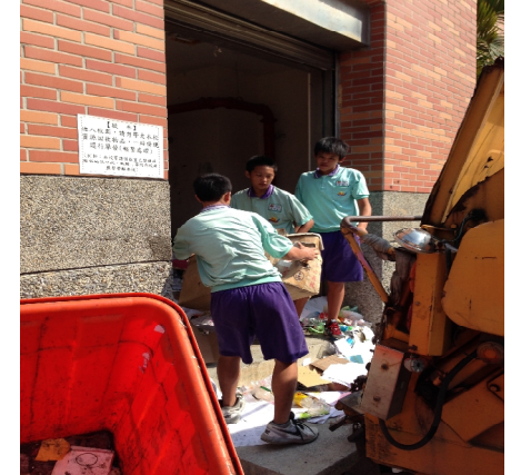
【學校衛生】資源回收