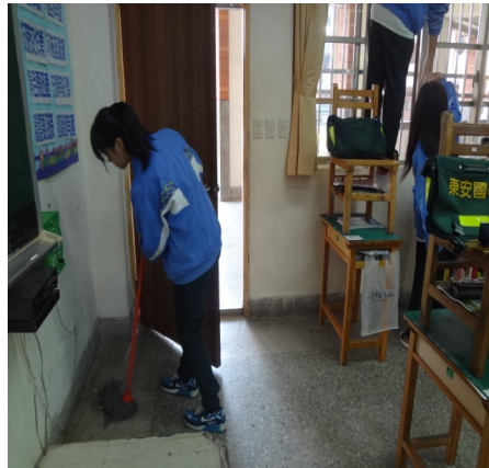
【學校衛生】每週五全校消毒