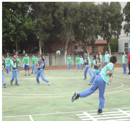
【性教育】班際躲避球賽