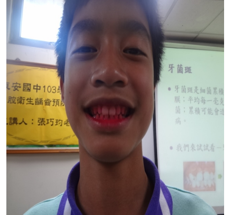
【口腔衛生】牙菌斑檢測