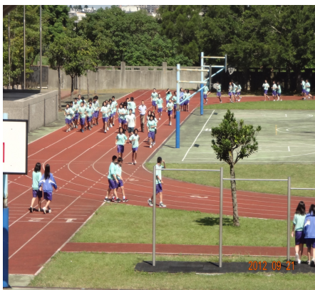
【健康體位】課間慢跑