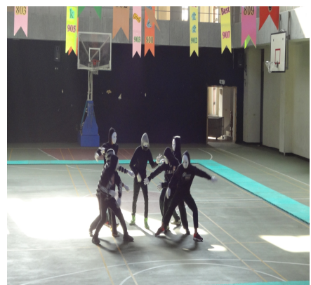
【健康體位】創意舞蹈大賽