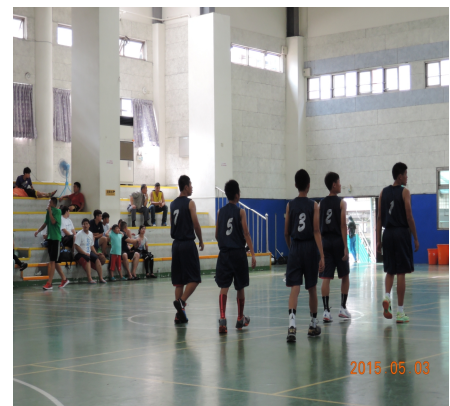
【健康體位】運動校隊