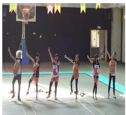
【健康體位】創意舞蹈大賽